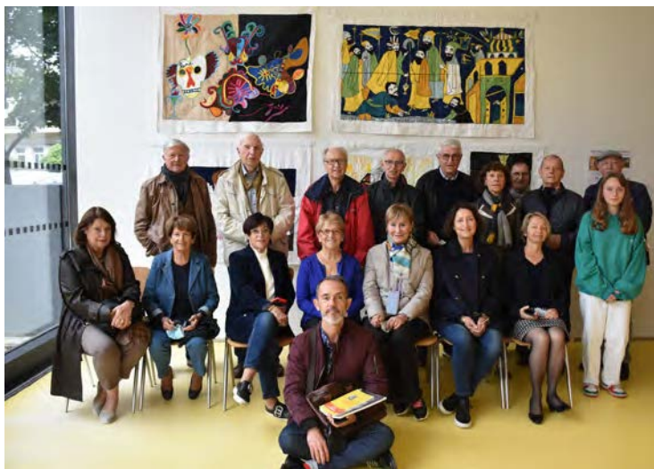
Quelques membres des Amis du Musée Matisse de Nice en visite au Cateau-Cambrésis

L'association des Amis du Musée Matisse a reçu au Cateau-Cambrésis une délégation des Amis du musée Matisse de Nice.