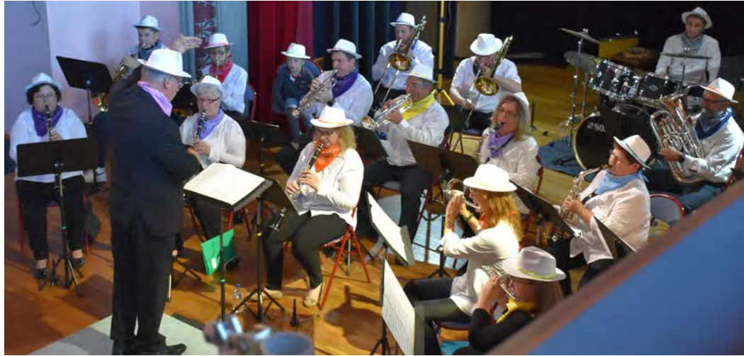
L'Harmonie Municipale lors du Concert d'Automne au Théâtre

« Le problème est que nous n'avons plus de renouvellement, depuis plusieurs années. Au fil du temps, les forces vives constatent les années passer sans la relève arriver depuis