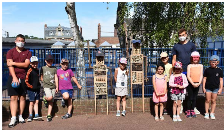
Les enfants ont entièrement réalisé des arbres à insectes en bois, lors d'ateliers animés par l'artisan Christophe Crebassa

Pour les plus grands de 6 à 10 ans, le projet était basé sur les 4 éléments, à l'effigie des super héros. En répondant