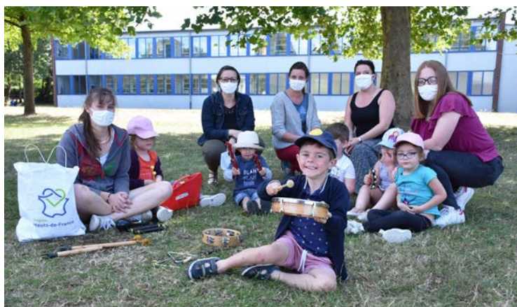
Des activités axées sur l'expression et la nature, dans un cadre spacieux et verdoyant... Vive les vacances au Cateau

Chez les petits, 34 enfants catésiens étaient accueillis chaque semaine, répartis en 6 groupes gérés par 2 animateurs. Dès 9h, une garderie était opérationnelle, puis les activités s'enchaînaient : réveil musculaire, zumba, danse africaine pour le sport, ou encore théâtre, langage des signes, atelier bois pour l'expression artistique, et même cuisine.