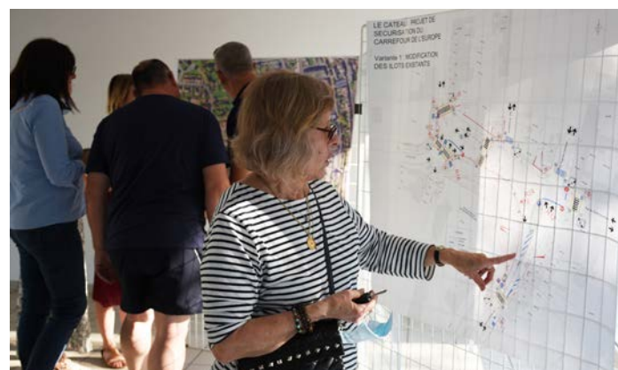
Les riverains ont pu poser des questions et découvrir les détails de ce que va devenir le Carrefour de l'Europe

L'enveloppe de la ville pour ces travaux est de 37 000 € TTC. ■