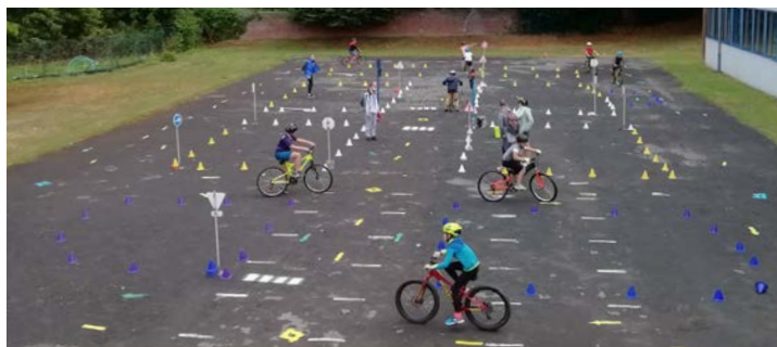
Même en vacances, la CA2C ne plaisante pas avec la sécurité

Après chaque activité, les enfants se détendaient dans la cour (pelouse, préau, verdure..) pendant qu'une animatrice désinfectait le mobilier. Les jeunes en service civique ont aussi mis la main à la pâte en participant aux mesures d'hygiène. Matin et soir, chaque salle de classe était nettoyée par du personnel communal. ■