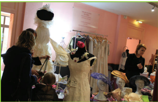
9 avril 2016 - Inauguration du salon du mariage L'association de la Commune Libre du Corbeau a organisé avec succès son premier salon du mariage au Théâtre René Ledieu