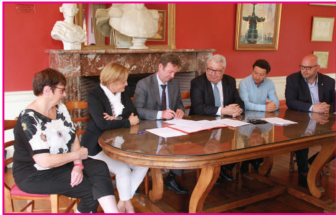
4 juillet 2016 - Des enfants de l'IME à l'école Matisse Signature de la convention tripartite (Rectorat - IME - Ville) pour l'accueil d'enfants de l'IME au sein de classes du groupe scolaire Matisse.