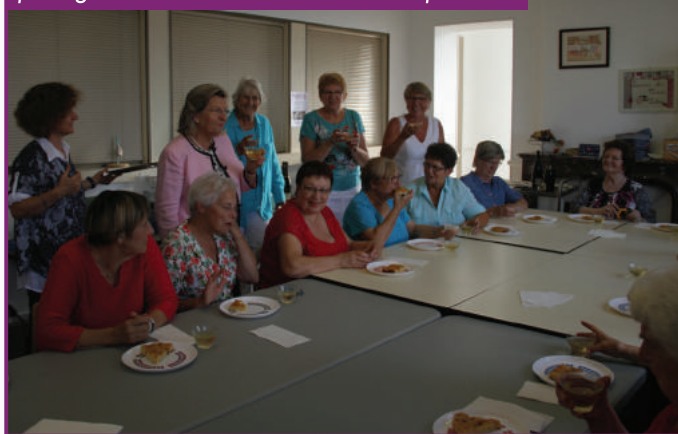
La traditionnelle tarte au sucre partagée avec le Club Loisirs du Temps Libre