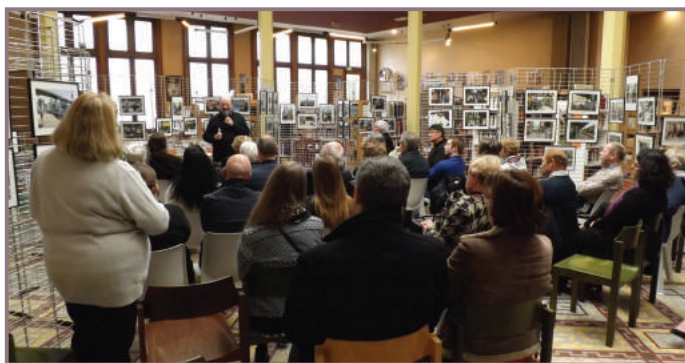
30 avril 2016 - Les rencontres de la bibliothèque Traditionnel rendez-vous mensuel, la rencontre du mois d'avril a cette fois emmené les participants dans un magnifique voyage à New-York...