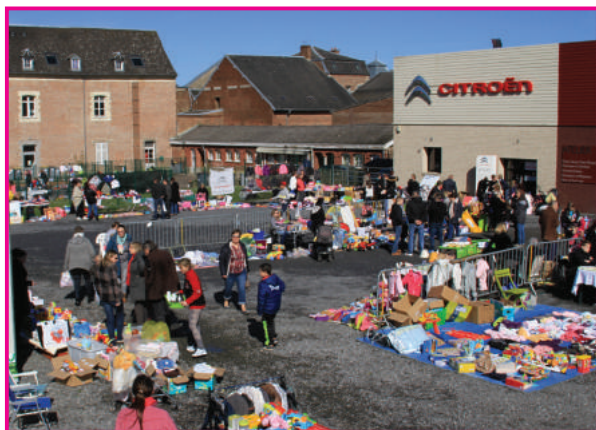
10 avril 2016 - Braderie du Relais d'Assistants Maternelles Joli succès pour la braderie du RAM