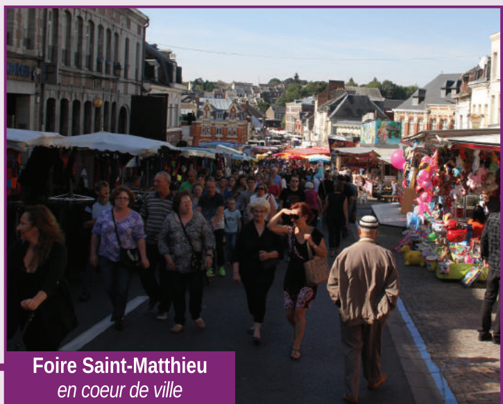
Foire Saint-Matthieu en coeur de ville