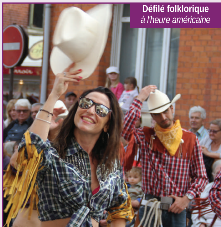
Défilé folklorique à l'heure américaine