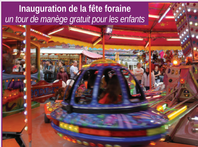
Inauguration de la fête foraine un tour de manège gratuit pour les enfants