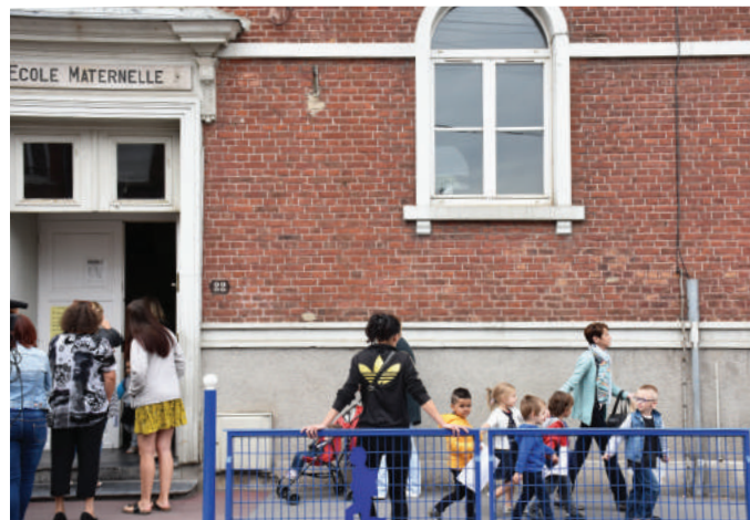
Face à des effectifs en baisse depuis 2016 et à la construction de la future école Langevin, l'école maternelle Seydoux pourrait se métamorphoser en crèche.

• Vote : 23 pour, 4 contre, 1 abstention, 1 non-participation au vote.